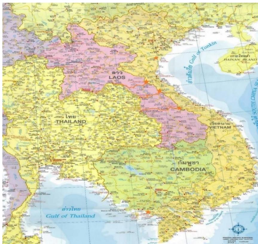
พื้นที่โครงการ

4.3 พื้นที่โครงการซึ่งสอดคล้องกับยุทธศาสตร์การพัฒนาประเทศของเวียดนาม