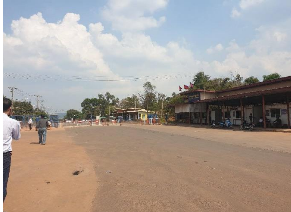
บริเวณจุดผ่านแดน