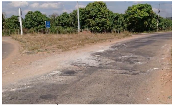
สภาพพื้นผิวถนนที่ชำรุดเสียหาย