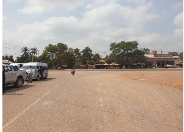
บริเวณทางแยกของถนนหมายเลข 67