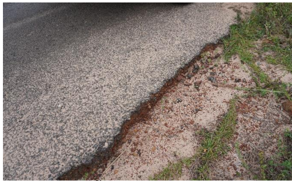
สภาพพื้นผิวถนนที่ชำรุดเสียหาย